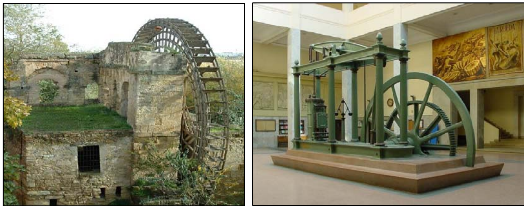
▲ شکل (۲): سمت راست؛ موتور بخار وات (قرن ۱۸ م.) - سمت چپ؛ سیستم انتقال آب در قرطبه-اسپانیا؛ تمدن اسلامی [۷].

"اخلاق مسلمین صدر اسلام، نسبت به سایر اقوام دنیا برتری داشته است. آن‌ها در مروت و انصاف، اعتدال و نیکی، مهربانی نسبت به اقوام مغلوبه، استواری در عهد و پیمان، سلوک و رفتار جوانمردانه، در تمام این خصایل ممتاز و نسبت به سایر اقوام خصوصاً اقوام اروپا در زمان جنگ صلیبی، حقیقتاً روح اخلاقی آن‌ها حیرت‌انگیز بوده است... و اگر ما دیانت را در اخلاق به آن اندازه که عموم تصور می‌کنند مؤثر بدانیم، پس باید قائل شویم که تعلیمات اخلاقی قرآن به مراتب بالاتر از تعلیمات اخلاقی انجیل بوده است، زیرا مسلمین در نیکوکاری از نصارا فرسنگ‌ها جلو بوده‌اند... اسلاف ما به وسیله معاشرت و مراودت با اعراب (مسلمانان) اطوار بربریت خود را به تدریج ترک گفته‌اند، و اخلاق جوانمردانه و وظایف اخلاقی مانند مهربانی و عاطفه به زنان و شفقت به بچه‌ها و پیران و پای‌بندی به عهد و امثال آن تماماً چیزهایی است که از مسلمین آموختند [۵]."